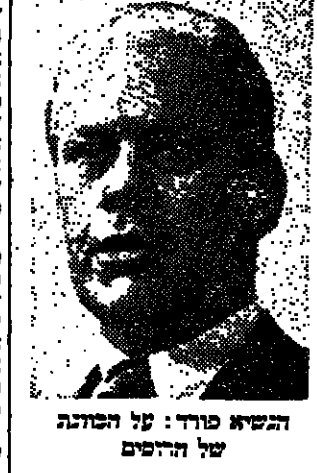
הנשיא פורד על הכתב

התנועה הלאומית והתנועה הציונית. התנועה הלאומית והתנועה הציונית. התנועה הלאומית והתנועה הציונית. התנועה הלאומית והתנועה הציונית.